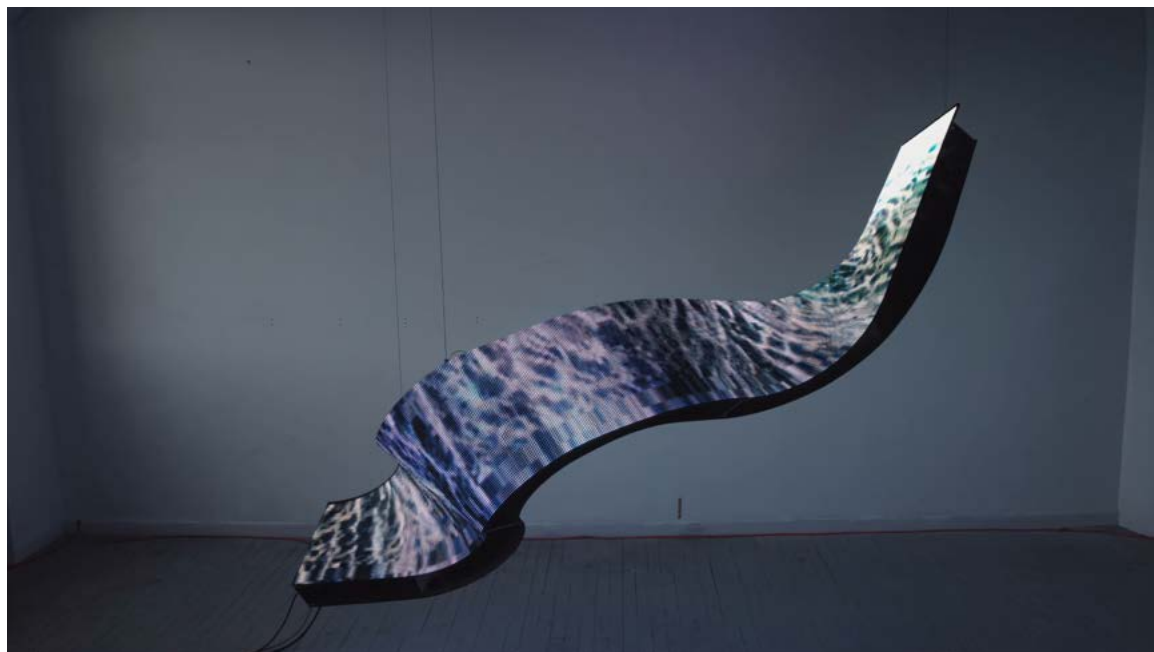
Chasing Waterfalls , Collectif Hidden Edges (Myriam Bleau & Lucas Paris, Cinzia Campolese, Emma Forgues, Baron Lanteigne), 2023 (Écran LED torsadé, 3,2 mètres de long)